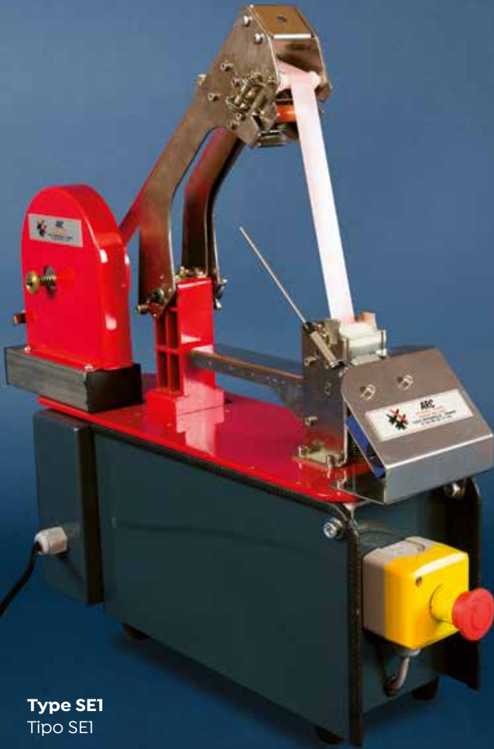
Type SE1 Tipo SE1