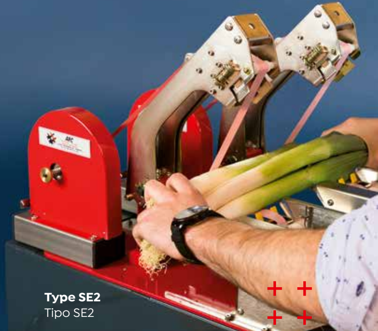
Type SE2 Tipo SE2